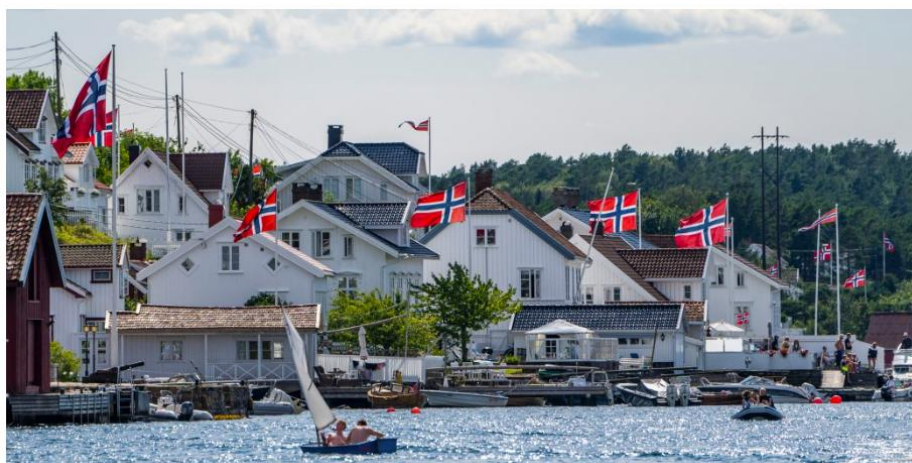
Strandsonerommet har vært et betent politisk og juridisk stridstema de siste ti årene.

Kursets tredje dag vil ta for seg byggesaksbehandling. Vi ser på koblingene mellom plandelen og byggesaksdelen i loven. Overgangen fra plandelen til byggesaksdelen byr på, rettslig sett, skifte av kommunenes rolle og ansvar, og skillet mellom juss og politikk trer klarere frem. Vi tar for oss kravene til byggesøknader og til kommunens søknadsbehandling, og byggesaksdelens prinsipielle utgangspunkt “byggeretten” ses opp mot kommunens handlingsrom til å styre og stanse tiltak. Denne dagen tar også for seg ulovlighetsoppfølging, fra vurderingen av om det foreligger en ulovlighet som skal følges opp, til virkemidlene kommunene har til rådighet når de følger opp ulovligheter.